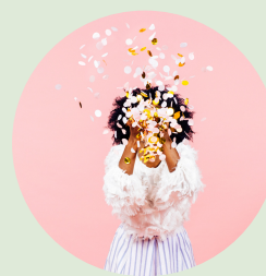
Návrh projektového záměru

Tyto moduly jsou k dispozici na projektové platformě - připravte se na proměnu své podnikatelské vize a změňte svět k lepšímu díky udržitelnému podnikání! 🌱📁