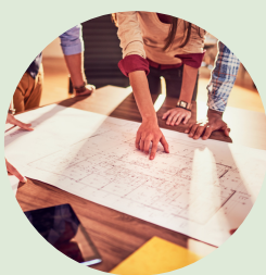
Psaní podnikatelského plánu