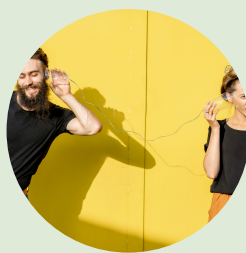
Marketing a komunikace