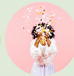
Diseño de Idea de Proyecto

Estos módulos están disponibles en la plataforma del proyecto. ¡Prepárate para transformar tu visión empresarial y marcar la diferencia en el mundo con negocios sostenibles! 🌱📁