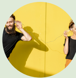
Marketing y Comunicación