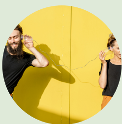
Marketing e comunicazione