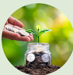
Piano di investimenti